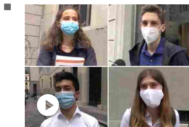
Milano, gli studenti: «Amarezza per l'anno bello del lic...