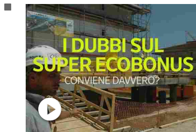
Super ecobonus al 110%: conviene davvero? I dubbi sugli sgra...