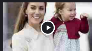
Charlotte d'Inghilterra comple 4 anni: la principessa cresce sempre