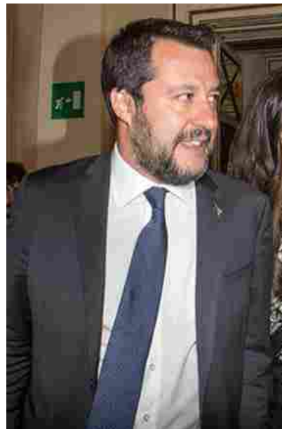
5. Matteo Salvini